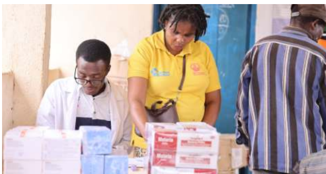
Assistante pharmacienne vérifie le packing list avec l'équipe du centre de santé à Munene

les maladies hydriques, la Prévention contre les maladies hydriques, la prévention contre le paludisme, la prévention contre le VIH/SIDA, les bonnes pratiques d'hygiène alimentaire, la bonne utilisation des installations sanitaires, les bonnes pratiques alimentaires et nutritionnelles, l'importance de la vaccination et respect du calendrier vaccinal, la coexistence pacifique et à la cohésion sociale, pratiques d'hygiène personnelle,